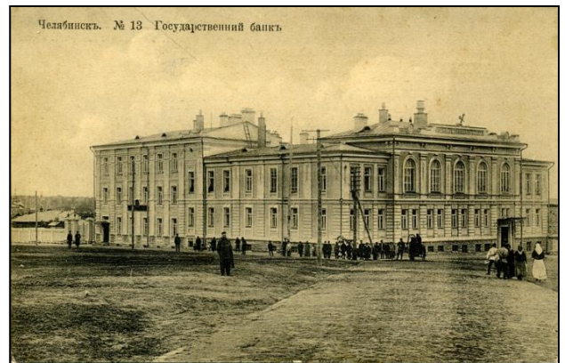
Открытка с исторической архитектурой здания Государственного банка.

В губстатбюро работало в тот период 140 человек. Руководящий состав секций, в основном, состоял из работников бывшего местного земства, которые имели достаточный опыт массовых статистических обследований.